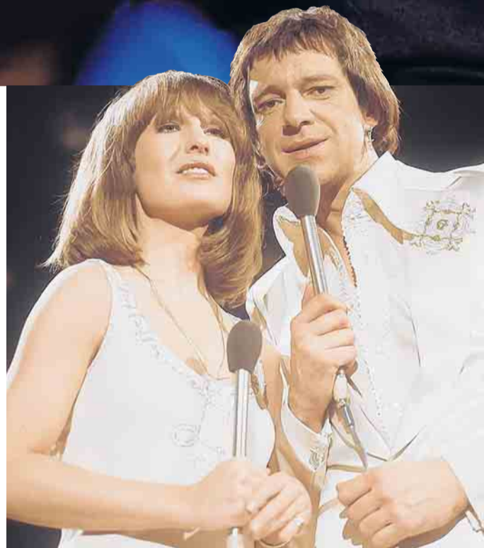
In 1969 maakten Liesbeth List en Ramses Shaffy samen de klassieker 'Pastorale'.

'Ik troost me met de gedachte dat hij alle drukproeven nog heeft gezien. Liesbeth List vertelde me ook dat hij straalde van geluk en trots als zij het met hem over het boek had. En pas op: dit is echt geen verbloemde biografie. Hij heeft het zeldzaam openhartig over zijn LSD-gebruik en zijn alcoholverslaving.' Dankzij het boek weten we toch ook hoe Shaffy voortleeft in de ge-