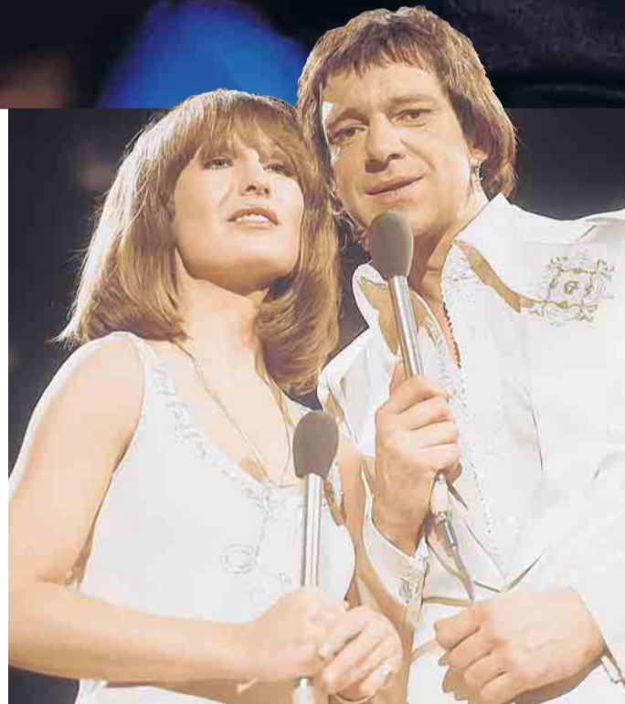
In 1969 maakten Liesbeth List en Ramses Shaffy samen de klassieker ‘Pastorale’.

‘Ik troost me met de gedachte dat hij alle drukproeven nog heeft gezien. Liesbeth List vertelde me ook dat hij straalde van geluk en trots als zij het met hem over het boek had. En pas op: dit is echt geen verbloemde biografie. Hij heeft het zeldzaam openhartig over zijn LSD-gebruik en zijn alcoholverslaving.’ Dankzij het boek weten we toch ook hoe Shaffy voortleeft in de ge-