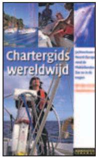
door Jan Willem Veenhof