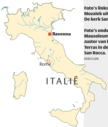
BIJ DE FOTO'S: Bezoek Ravenna per fiets.

pleinen en binnenplaatsen en in alle theaters en kerken het Ravenna Festival plaats, met veel muziek (klassiek en modern), ballet en film. Aanrader is ook het Ravenna Blues Festival, compleet met een 'street parade' in New Orleansstijl. De studente Gianna di Paolo kan tevreden zijn. Ravenna heeft alre gekregen door terug te grijpen naar haar eeuwenoude status als culturele parel. Er zijn de laatste jaren goede wijnlokalen, cafés en restaurants bijgekomen, zoals het in een voormalige kerk ondergebrachte en door de filmwereld geïnspireerde Ristorante Cinema Alexander in de volkswijk San Rocca. Er worden onder meer concerten gegeven en films geprojecteerd.